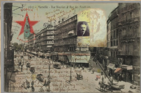
www.hwb1928.com © Renaud Vercey

Modération par Alain Paire, auteur de « Chronique des Cahiers du Sud, 1914-1966 », Editions de l'IMEC, 1993 et co-réalisateur avec François Mouren-Provensal, de films courts : série « Chroniques d'Aix à Marseille », productions : Les Films du Soleil / Mativi-Marseille.