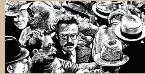
Dessin de Walter Benjamin à Marseille © Frédéric Pajak