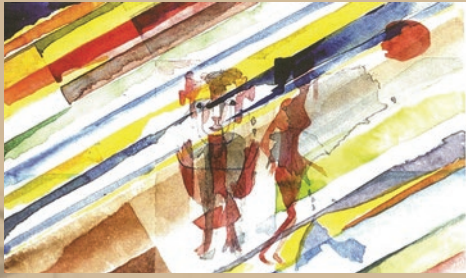
Aquarelle © Guy Desgrandchamps