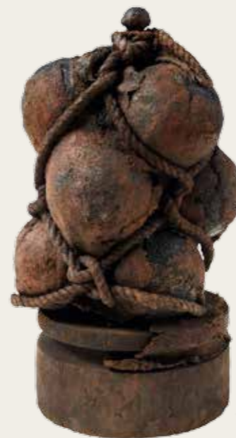
Projectile de canon dit "grappe de raisin" découvert sur l'épave du vaisseau de soixante-quatorze canons le Juste (1759).

La guerre est le compagnon de route attiré du monde maritime de l'époque moderne. L'archéologie sous-marine en témoigne. Outre d'innombrables canons, boulets, pistolets et pierriers, les épaves de la période ont livré de modestes instruments de chirurgie qui rappellent la violence des combats auxquels étaient confrontés les équipages autant que les maladies dont ils avaient à souffrir.