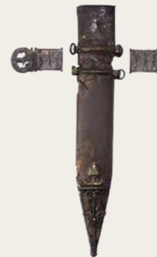
Fourreau de glaive de légionnaire avec boucle, 1 er siècle apr. J.-C., épave de Porto Nuovo, à Porto Vecchio (Corse), Inventeur Jacques Chiapetti, fouilles Jacques Chiapetti et Hélène Bernard / Drassm