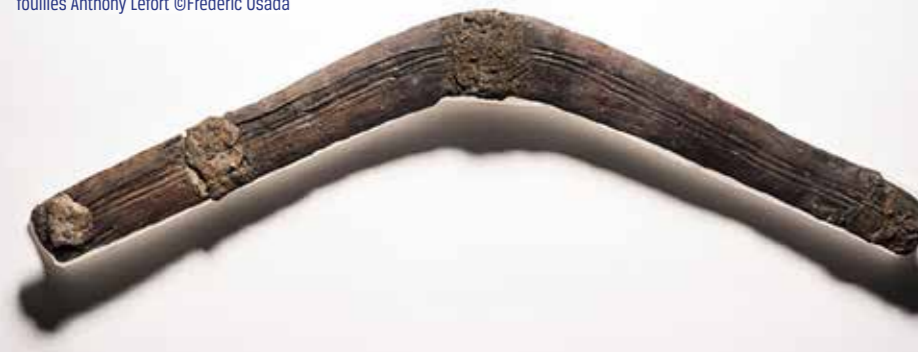
Bâton de jet, fin du II e siècle ou du début du I er siècle av. J.-C., seul « boomerang » gaulois à ce jour connu, fouilles Anthony Lefort

la zone économique exclusive, à 200 milles des côtes. Les sociétés humaines ayant très largement privilégié les implantations littorales, l'archéologue qui œuvre à la frontière des deux mondes du terrien et du marin y est confronté à une diversité toute particulière de vestiges.