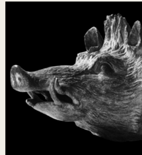
Hure de sanglier en bronze servant à décorer l'éperon supérieur d'un navire romain, découvert en 1960 dans le golfe de Fos. Musée d'Istres

Du plus fragile esquif au plus lourd vaisseau de ligne, tous les navires doivent leur existence à un savoir-faire patiemment développé par des générations de charpentiers, puis de maîtres-constructeurs, d'ingénieurs et d'architectes navals. Pour édifier les carènes, le bois longtemps a prévalu. Le fer ensuite a triomphé avant que le plastique et le composite ne viennent aujourd'hui contester cette suprématie. L'étude des coques perdues sous les mers renseigne sur l'évolution des techniques de construction navale, les outils et les matériaux utilisés. Il importe en conséquence que l'archéologue enregistre méthodiquement leurs vestiges de sorte à les interpréter parfaitement pour mieux appréhender les navires d'autrefois.