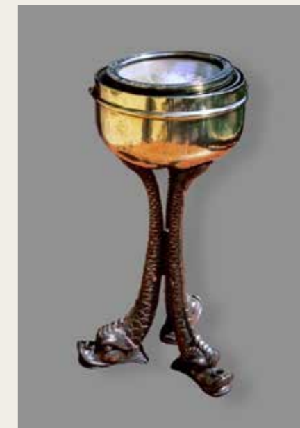
Compas de route du Dalton, vapeur anglais, coulé en rade de Marseille en 1928

Entre conservation du patrimoine et recherche archéologique, l'analyse des premiers vapeurs, comme des cargos, paquebots, cuirassés et sous-marins victimes des grands conflits mondiaux, ouvre sur de fécondes problématiques de recherche. Elle met aussi en lumière, au fil du littoral, une litanie ininterrompue de naufrages liés à l'histoire des guerres navales des XIX e et XX e siècles et sauve de l'oubli ces mondes brisés qui attestent de la folie meurtrière des hommes.