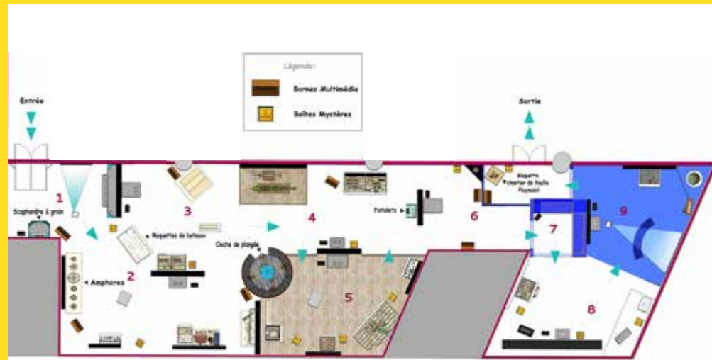
Plan de l'exposition © Jean-Pierre Baudu, Fouet Cocher

À l'occasion du 50 e anniversaire du Département des recherches archéologiques subaquatiques et sous-marines, la Ville de Marseille, le Drassm et Columbia River proposent au public une plongée au cœur de l'archéologie sous-marine française.