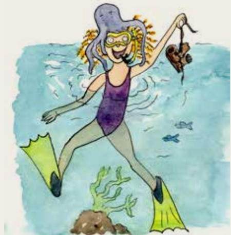
Hermine! Dessin d'Hermine Baron

Au fil des neuf séquences qui scandent l'exposition, 50 objets, sublimes ou modestes, récents ou très anciens, mais toujours emblématiques des cinquante années de recherches, racontent les grandes découvertes de l'archéologie sous-marine française.