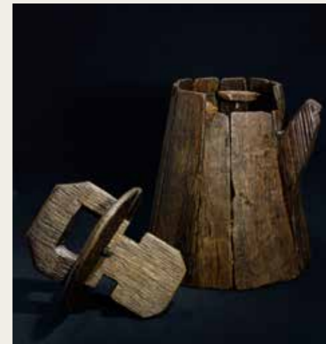
Bidon d'équipage et sa poignée de fermeture en chêne, épave de la Dauphine perdue en 1704 au large de Saint-Malo. Inventeur Jean-Pierre Génar, fouille Michel L'Hour, Elisabeth Veyrat /Drassm

Du chaos du naufrage, des hommes se sont enfuis. D'autres ont péri! Puis le temps a passé. Figés dans leur linceul de sédiments, les objets qui accompagnaient leur vie maritime ont trouvé une nouvelle stabilité. Ils se sont conservés et attendent désormais l'archéologue qui saura les déchiffrer et assurera leur pérennité.