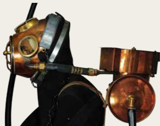
Appareil-plongeur Rouquayrol-Denayrouze, modèle 1864, 8 l.

la Direction des recherches archéologiques sous-marines (DRASM), qu'il établit à Marseille, puis lança la construction d'un navire de recherche L'Archéonaute . Les archéologues allaient désormais assumer eux-mêmes l'étude du patrimoine immergé. L'archéologie sous-marine était née !