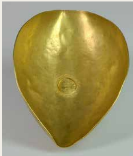
Plat en or décoré à l'origine d'un médaillon de l'empereur Gallien, golfe de Lava (Corse), III e s. apr. J.-C. Saisie judiciaire, expertise Michel L'Hour/Drassm

On estime de nos jours à près de 200 000 le nombre des biens culturels immergés qui peuplent les 11 millions de km 2 de l'espace maritime français. Ce patrimoine est pour l'essentiel caché. Éreintées par la mer, nombre d'épaves ne se signalent plus sur le fond que par de rares vestiges, ancres, canons, amas d'amphores ou barres de lest. Beaucoup d'autres, tapies sous une épaisse couche de sédiment, se dérobent au regard cependant que dans les profondeurs abyssales les épaves les mieux protégées attendent que les progrès de la robotique permettent aux archéologues de les étudier.