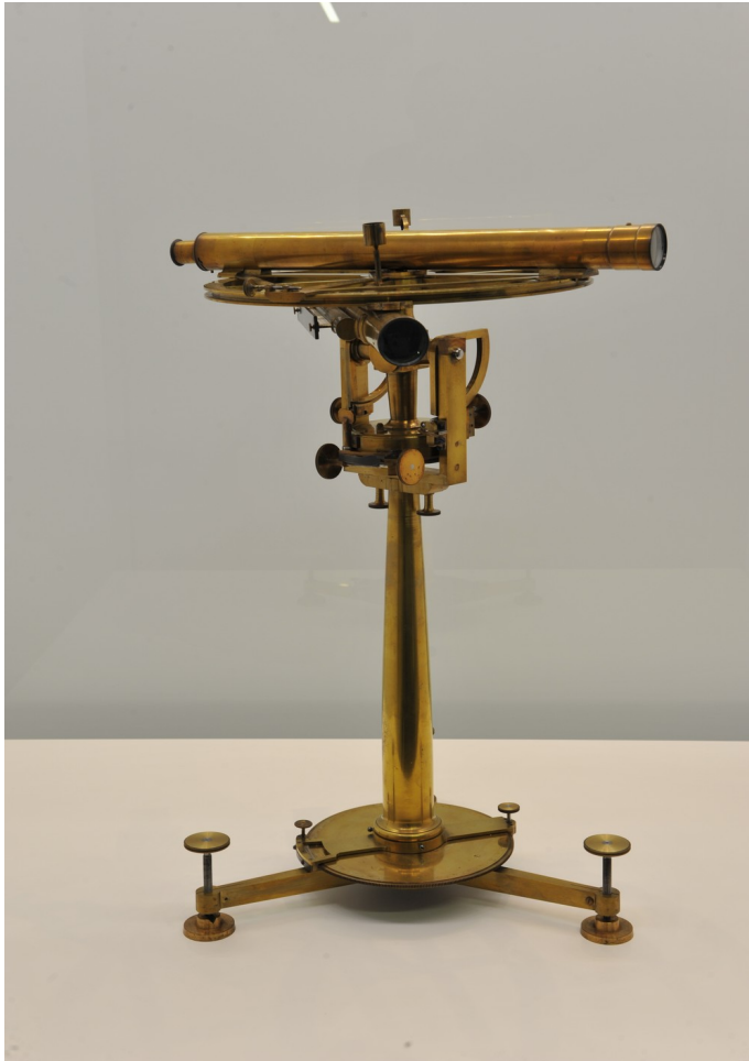
Cercle répéteur