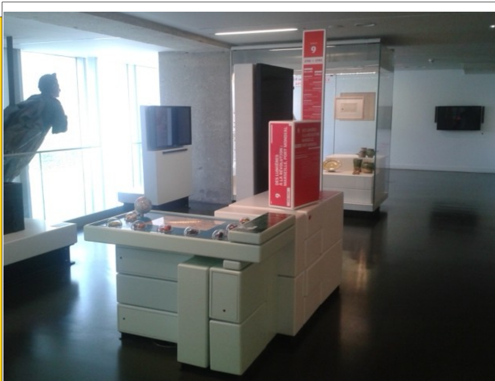
Vue de la séquence 9, musée d'Histoire de Marseille