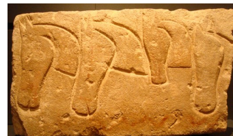
Photo du linteau aux quatre chevaux de Roquepertuse

Les élèves reproduisent un motif trouvé sur le site gaulois de Roquepertuse figurant quatre têtes de chevaux vues de profil. Cet atelier, abordant le thème du bestiaire, est combiné avec une visite des collections de Protohistoire.