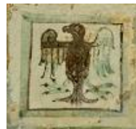
Carreau de pavement, vert et brun, représentant un aigle. ►

Les fouilles archéologiques ont permis la découverte de magnifiques carreaux de pavement décorés de vert et de brun, présentant des motifs géométriques, floraux ou animaliers. Les enfants choisissent le motif qu'ils souhaitent reproduire sur leur carreau (carreau déjà cuit) puis, appliquent les différentes couleurs. Les couleurs, réalisées à l'aide d'oxydes (Fer, Manganèse, Cobalt) utilisés au Moyen-Age, prendront leurs colorations définitives après cuisson.