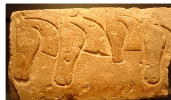
Photo du linteau aux quatre chevaux de Roquepertuse

Les élèves reproduisent un motif trouvé sur le site gaulois de Roquepertuse figurant quatre têtes de chevaux vues de profil. Cet atelier, abordant le thème du bestiaire, est combiné avec une visite des collections de Protohistoire provenant du Musée d'archéologie, nouvellement installées au Musée d'histoire.