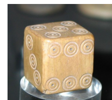
Dé en os (Cl.S.Marreau)

Pour cet atelier, les enfants s'essayent à plusieurs jeux et jouets antiques dont on connaît l'existence par les textes, les mosaïques ou les vases grecs. Ils découvrent, de manière ludique, les différentes façons de jouer ainsi que les jeux qui existaient à l'époque. La visite commentée mettra l'accent sur la vie quotidienne et sur les quelques jouets antiques présents dans les collections.