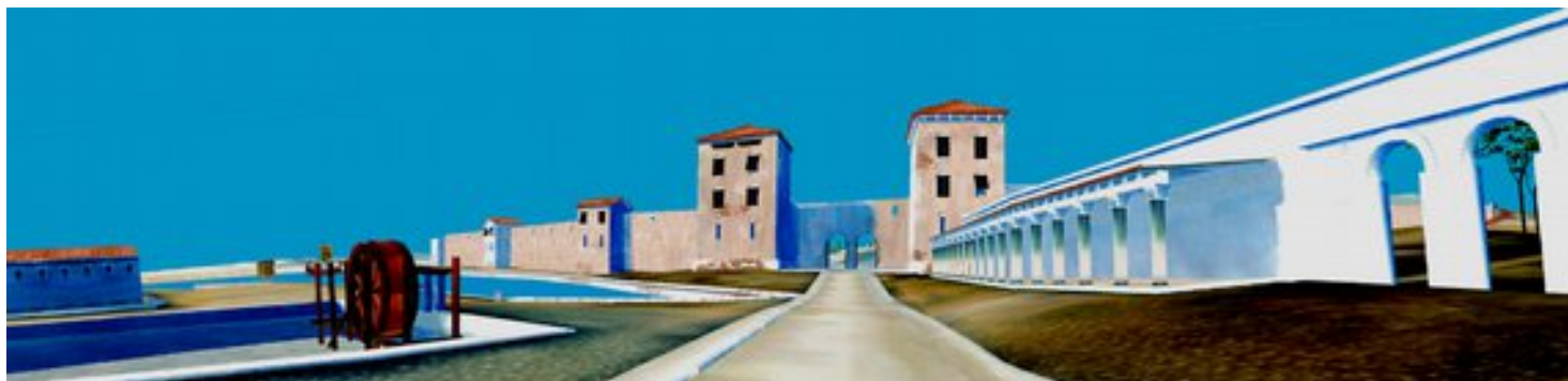
Évocation de l'entrée de la ville romaine, site archéologique du Port Antique, image extraite de l'extension numérique du musée d'Histoire de Marseille

Bonjour et bienvenue au musée d'Histoire de Marseille!