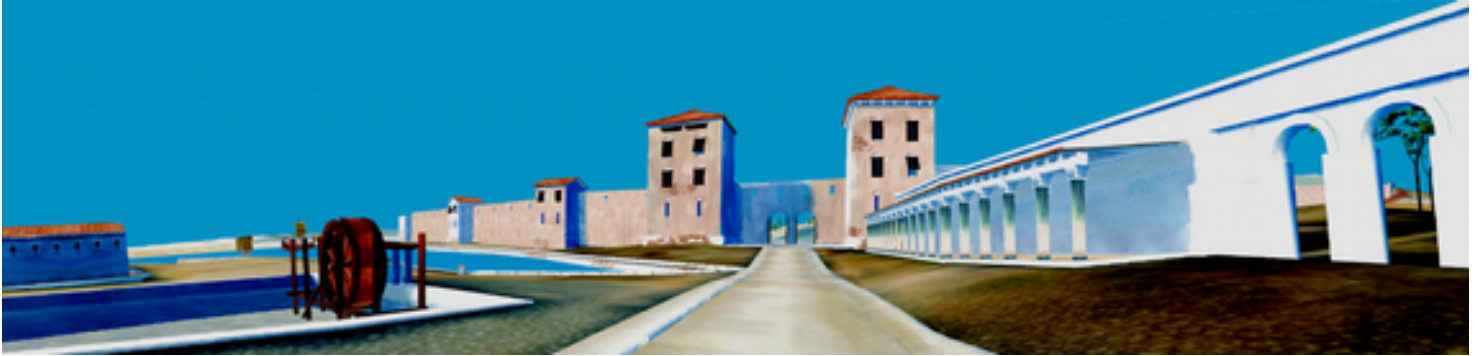
Évocation de l'entrée de la ville romaine, site archéologique du Port Antique

Bonjour et bienvenue au musée d'Histoire de Marseille !